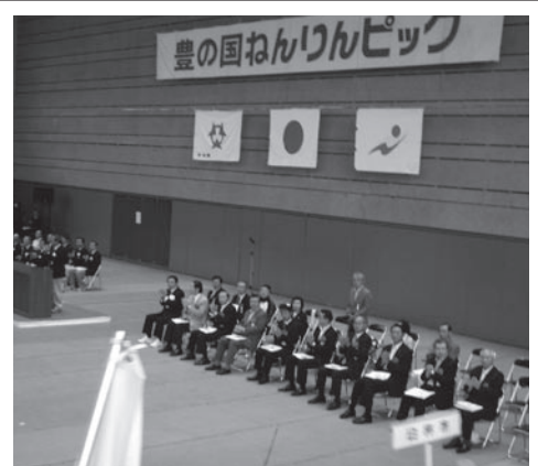
豊の国ねりんピック開会式