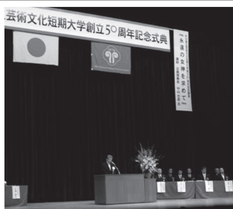
県立芸短大50周年記念式典