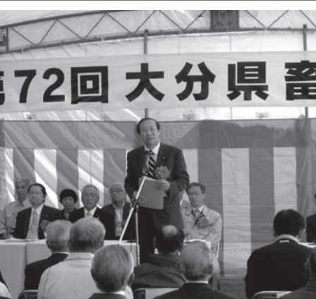
県畜産共進会 別府会場