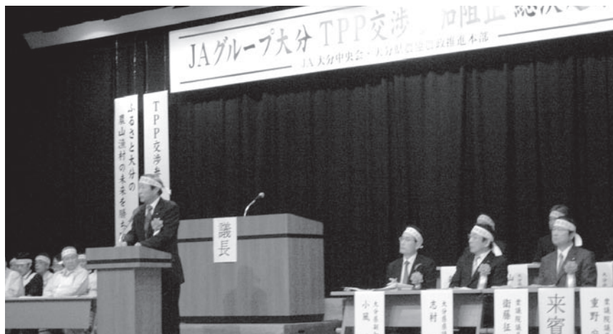
JA 大分 T P P 交渉参加阻止総決起集会

業は壊滅的な打撃を受けることになり ます。現在、日本の食糧自給率は40% ですが、これが一気に13%程度に低下す ると試算されています。政府や財界は、 日本も大規模化、株式会社化によって 競争力をつけることで対応可能としてい ますが、日本の農業の多くは集約化が 難しい中山間地域にあります。また、 株式会社化は戦後農政の基本とした耕 作者主義を一層解体することにつながり ます。