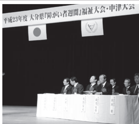
県障がい者週間 福祉大会・中津大会