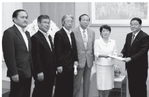
藤村官房長官への申し入れ

党の掲げる政策を実現するために、国会での質問だけでなく、総理官邸や各大臣に申し入れ、要請などを行なっています。