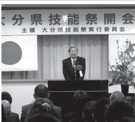
大分県技能祭開会式