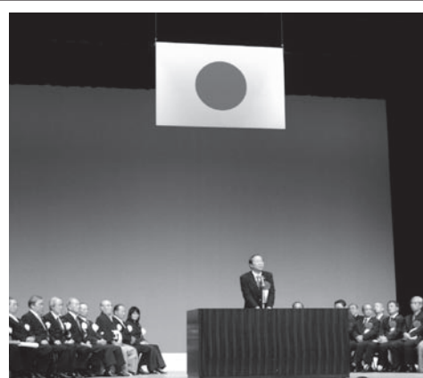
臼杵詩道会40周年記念式典