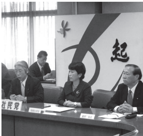
党幹事長として主催する常任幹事会

社民党全国連合で国会開会中は木曜日の午前8時30分から開かれます。時々の政治課題や選挙に向けた取り組みなどを議論します。